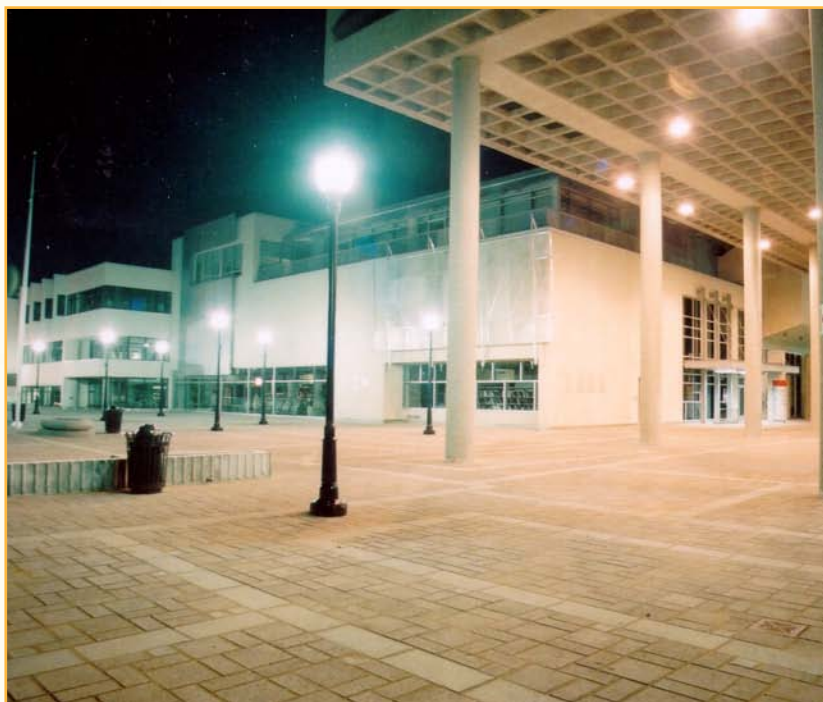
Hôtel de ville de Trois-Rivières, situé au 1325, place de l'Hôtel-de-Ville