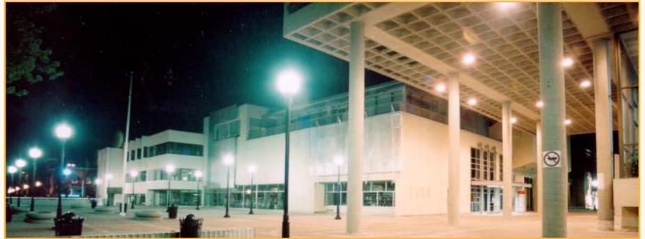
Maison de la culture de Trois-Rivières, située au 1425, place de l'Hôtel-de-Ville